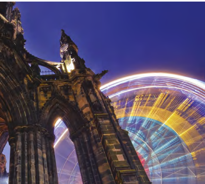
CYRCHFAN ▷ Caeredin